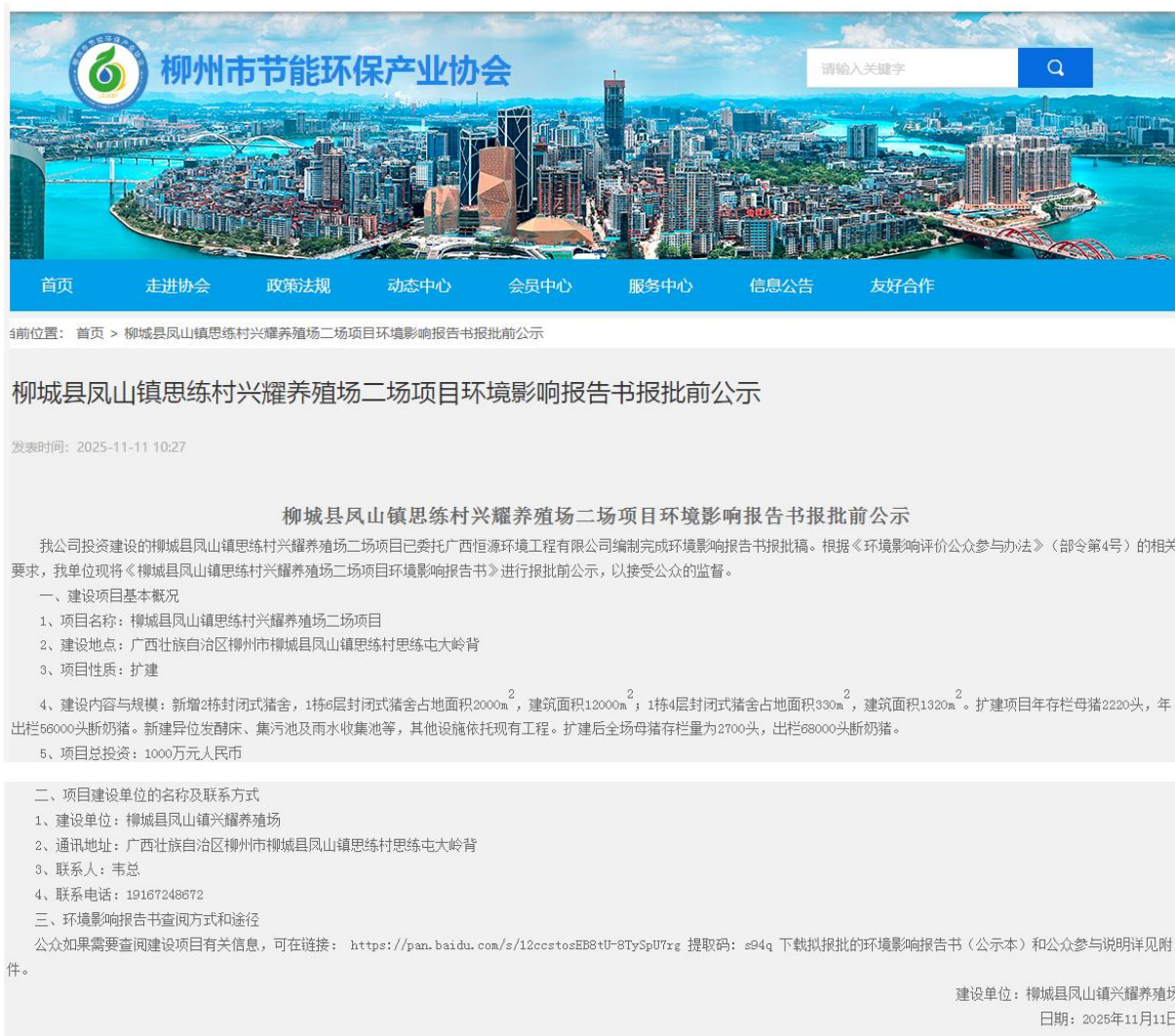
图 6 项目报批前公示截图