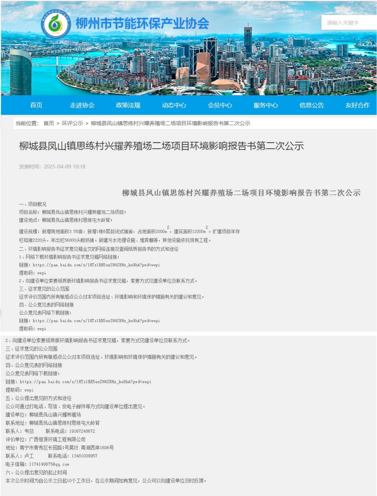
图 2 项目在柳州市节能环保产业协会网站第二次公示网上截图

开，且持续公开期限不得少于 10 个工作日。”的要求。公示网址： http://www.lzecep.com/nd.jsp?fromCollId=-1&id=528#_np=0_550_20 ，公示截图如下：