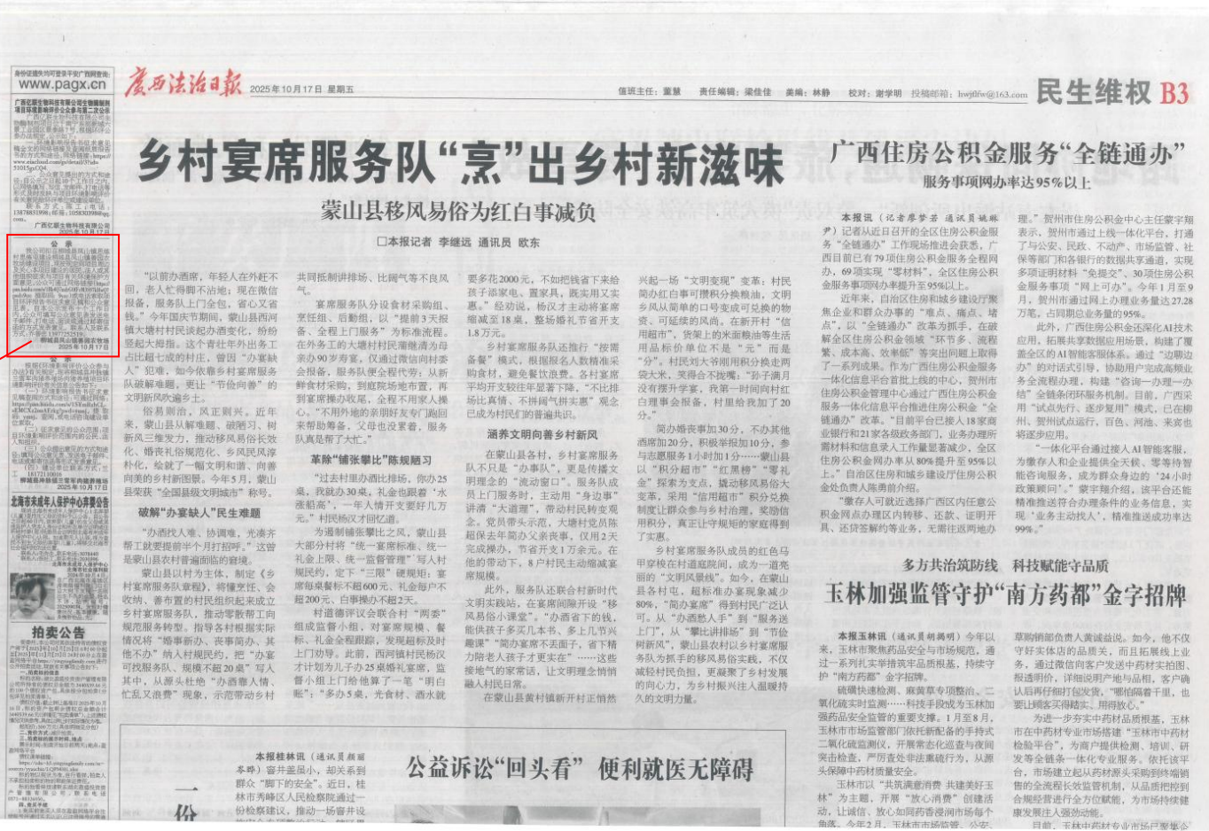
图3 广西法治日报登报公示截图（2025年10月17日刊登）