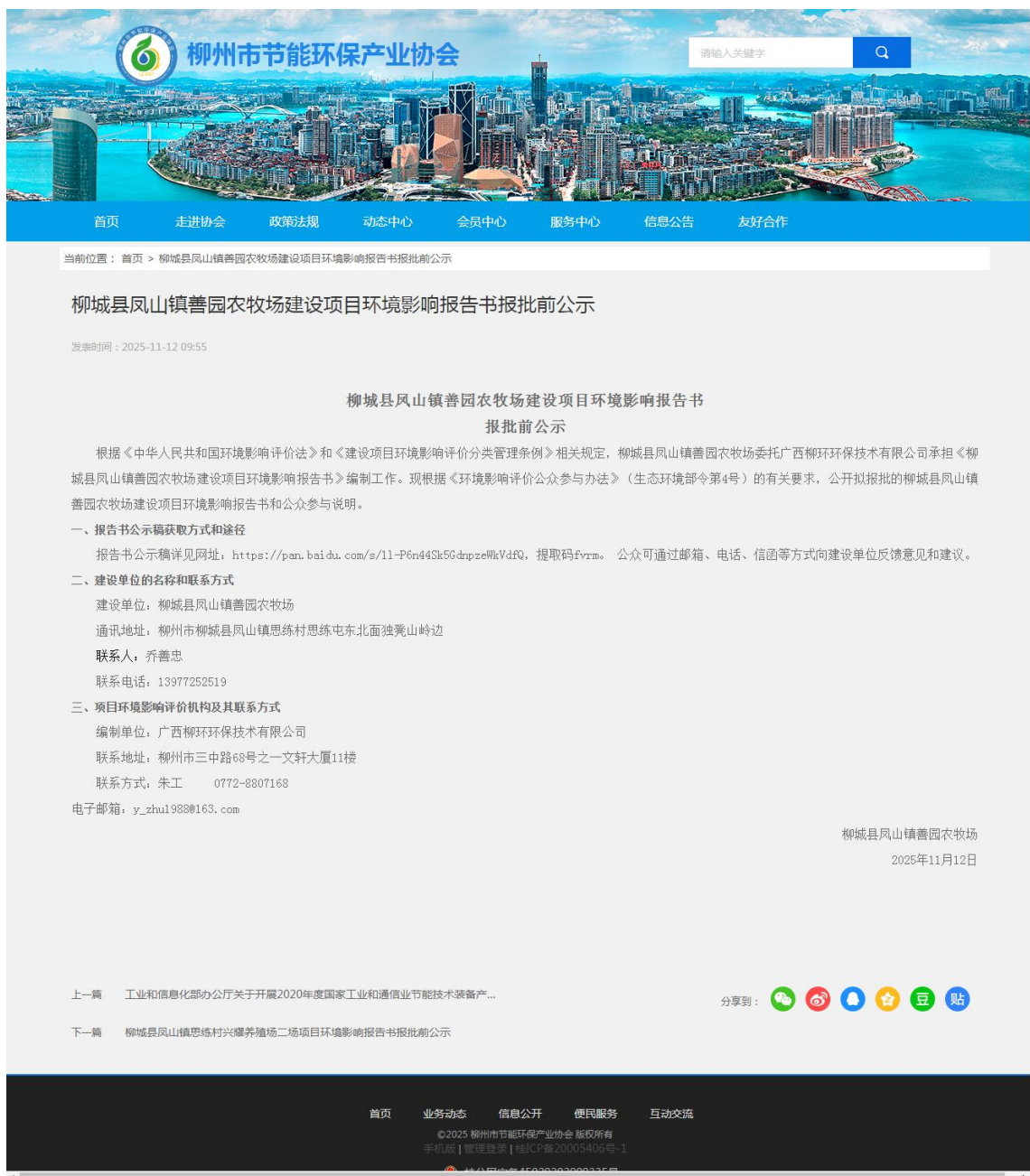
图 7 项目报批前公示截图