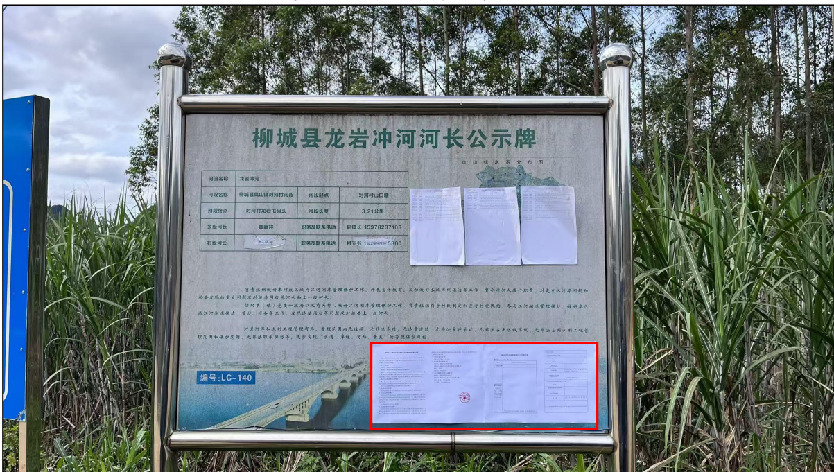
图 6 龙岩屯张贴公示照片