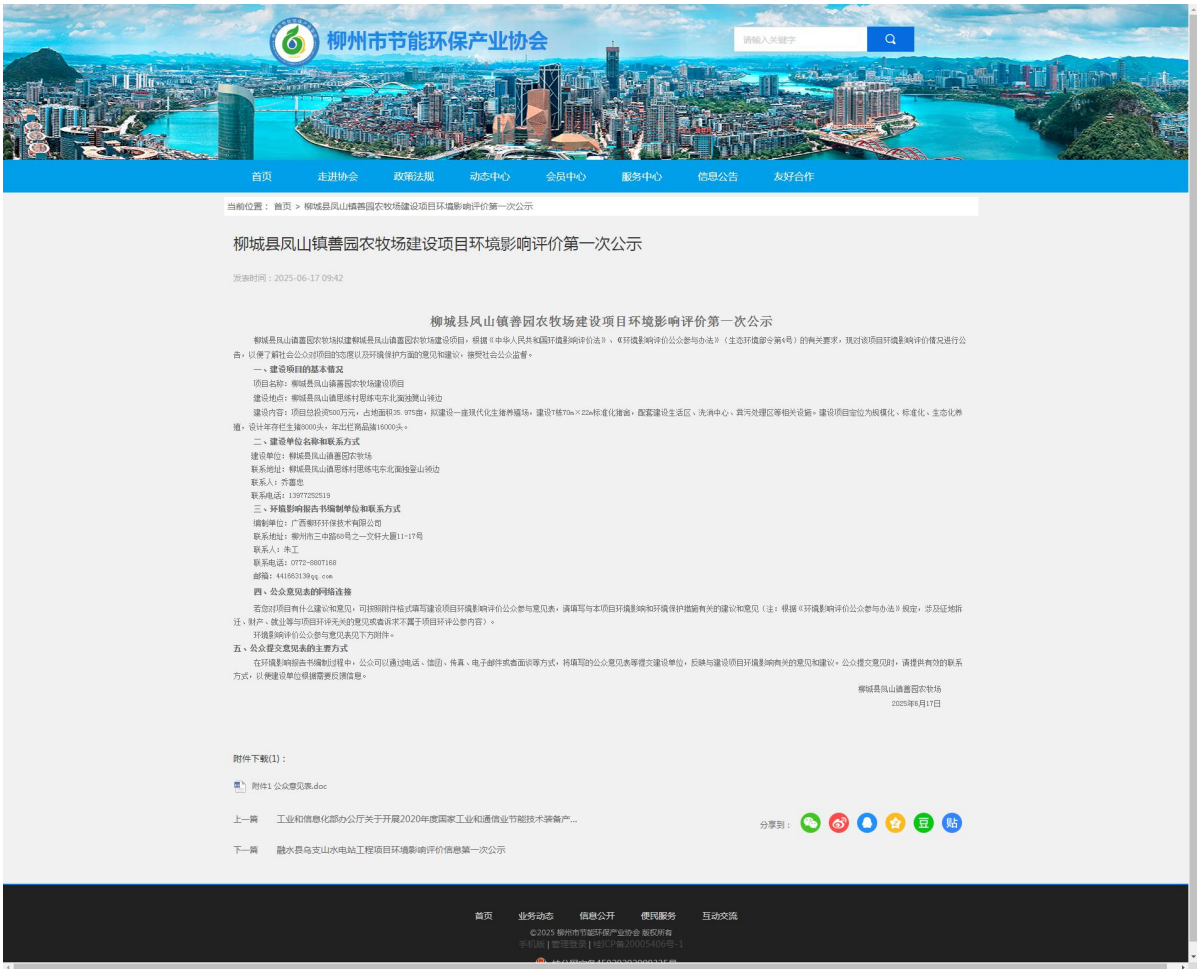
图 1 项目环评公众参与首次公示网上截图