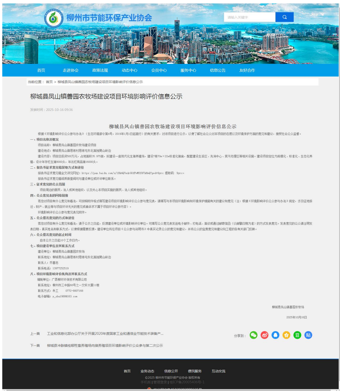
图 2 项目环评公众参与第二次公示网上截图