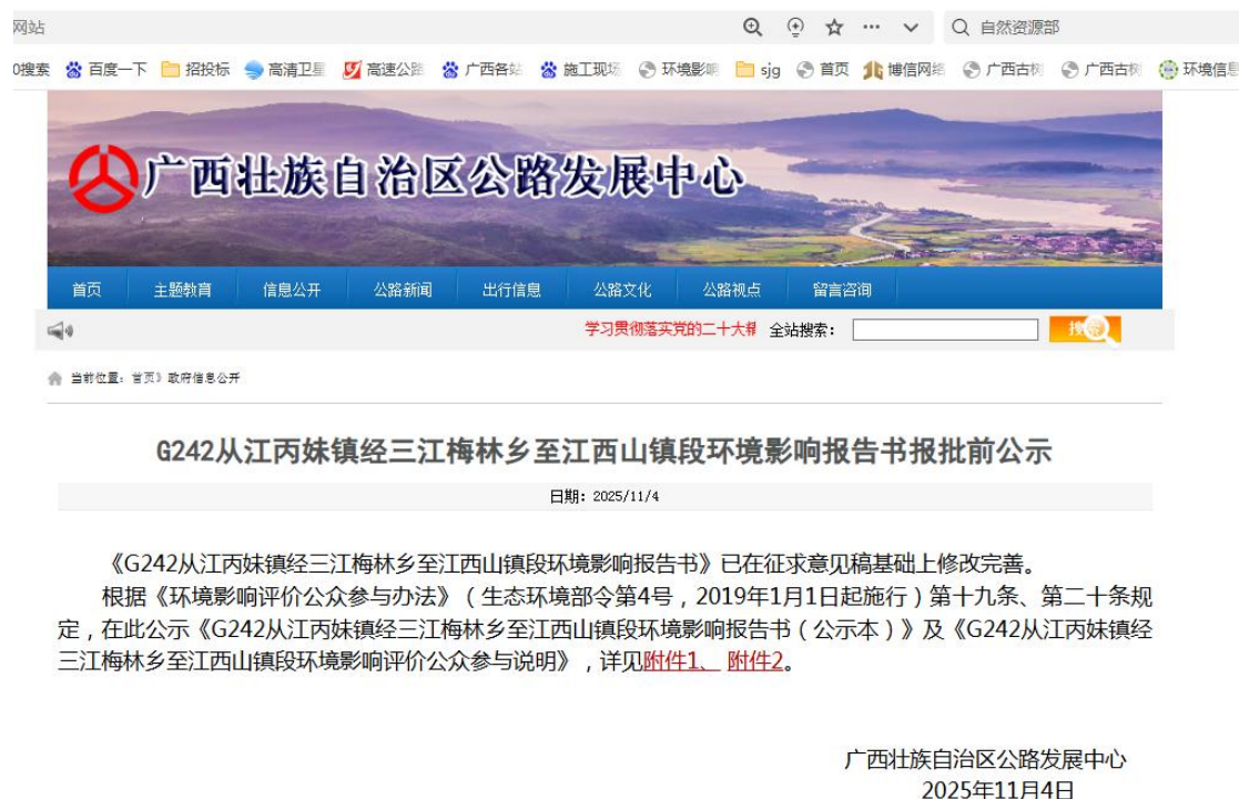
图 6 本项目环境影响报告书报批前公示

我公司于 2025 年 11 月 4 日在公司官网( http://www.gxglj.cn/news/?id=12889 )上公示了本项目的环境影响报告书及其公众参与说明,公示内容符合《办法》第十九条规定。