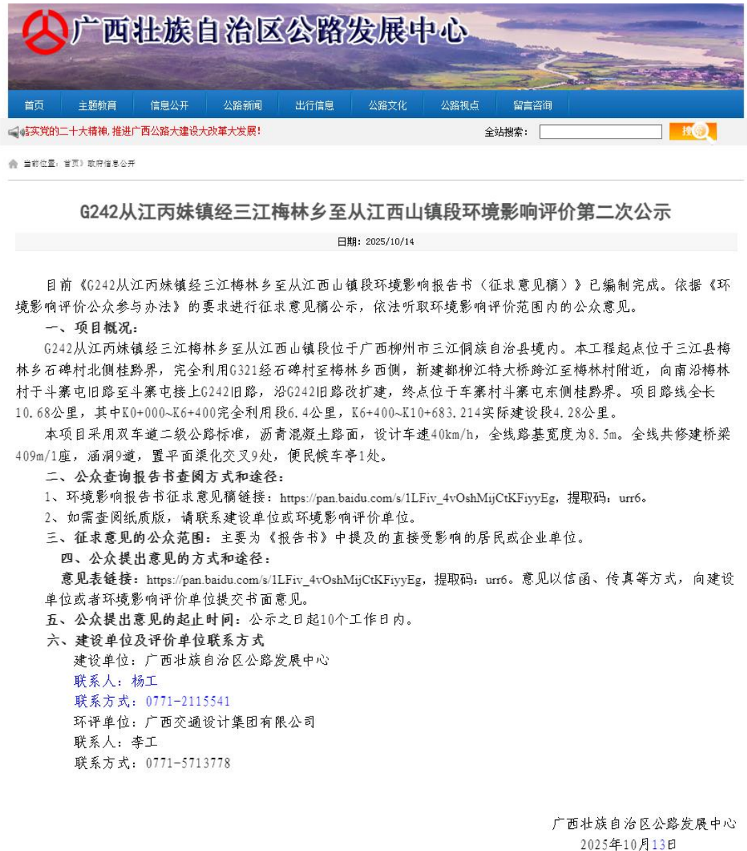
图 2 本项目环境影响报告书征求意见稿网上公示截图