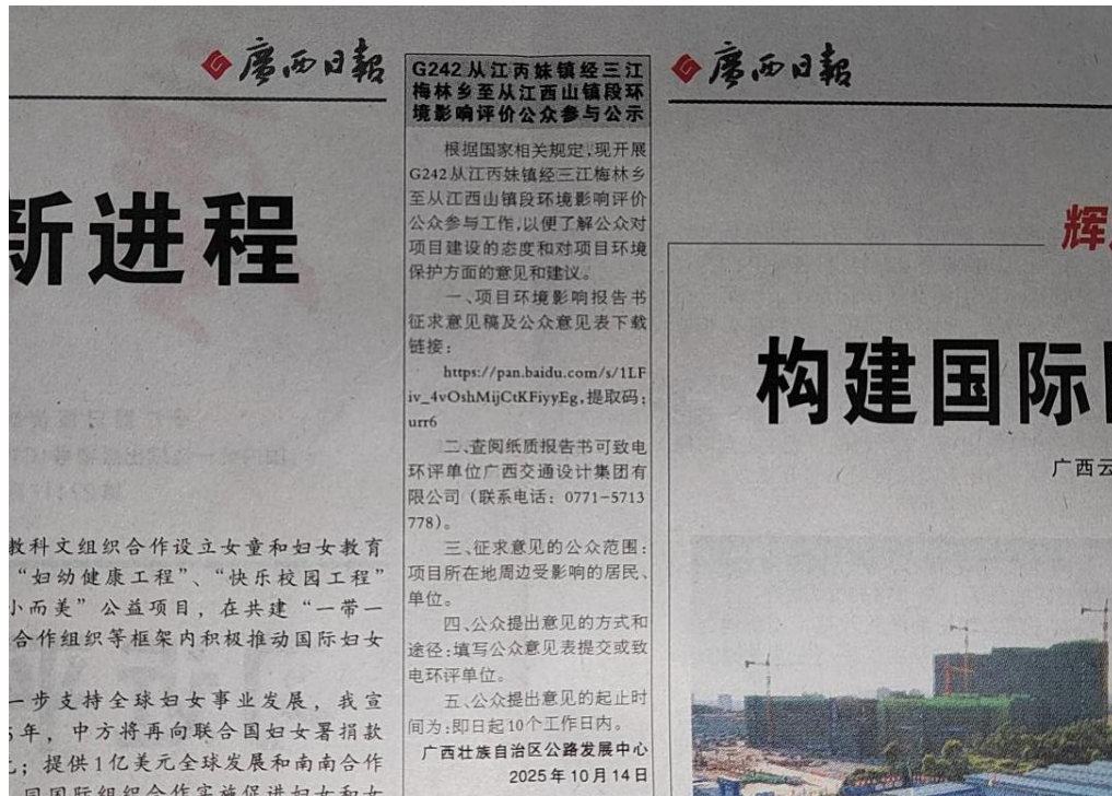
图3 本项目环境影响报告书征求意见稿登报公示照片（第1次）

我公司于2025年10月14日和2025年10月15日分别在广西日报上公示了本项目的环境影响报告书征求意见稿，登报公示照片见图3、图4。