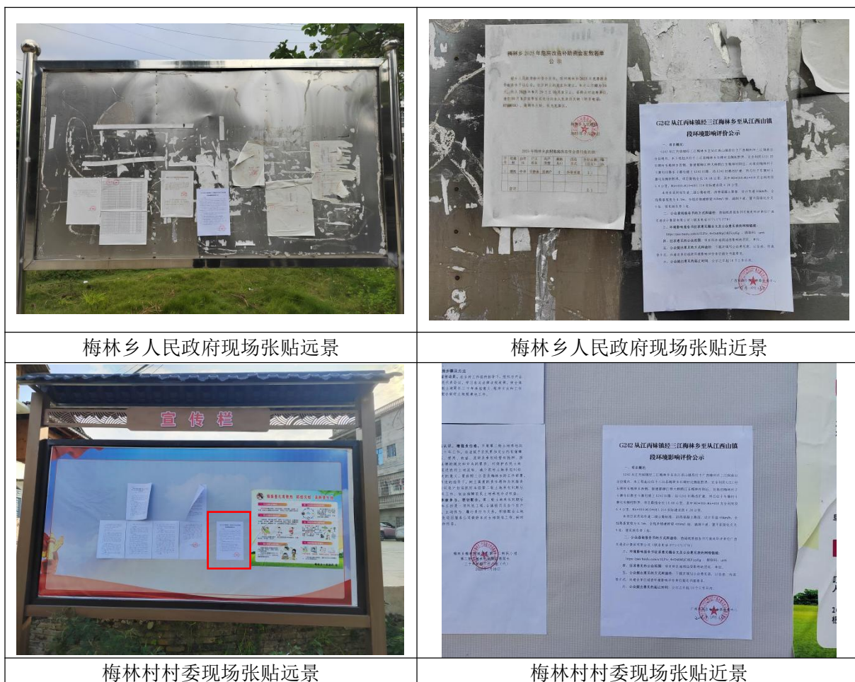
图5 本项目环境影响报告书征求意见稿张贴情况现场照片

我公司于2025年10月13日在本项目所在地的梅林乡人民政府、梅林村村委会现场张贴了公告，张贴公告的现场照片见图5。