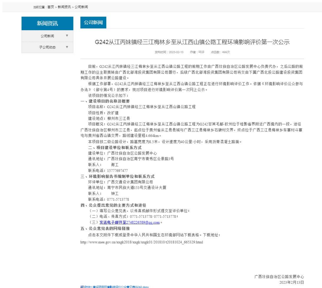
图 1 本项目首次环境影响评价信息网上公开截图