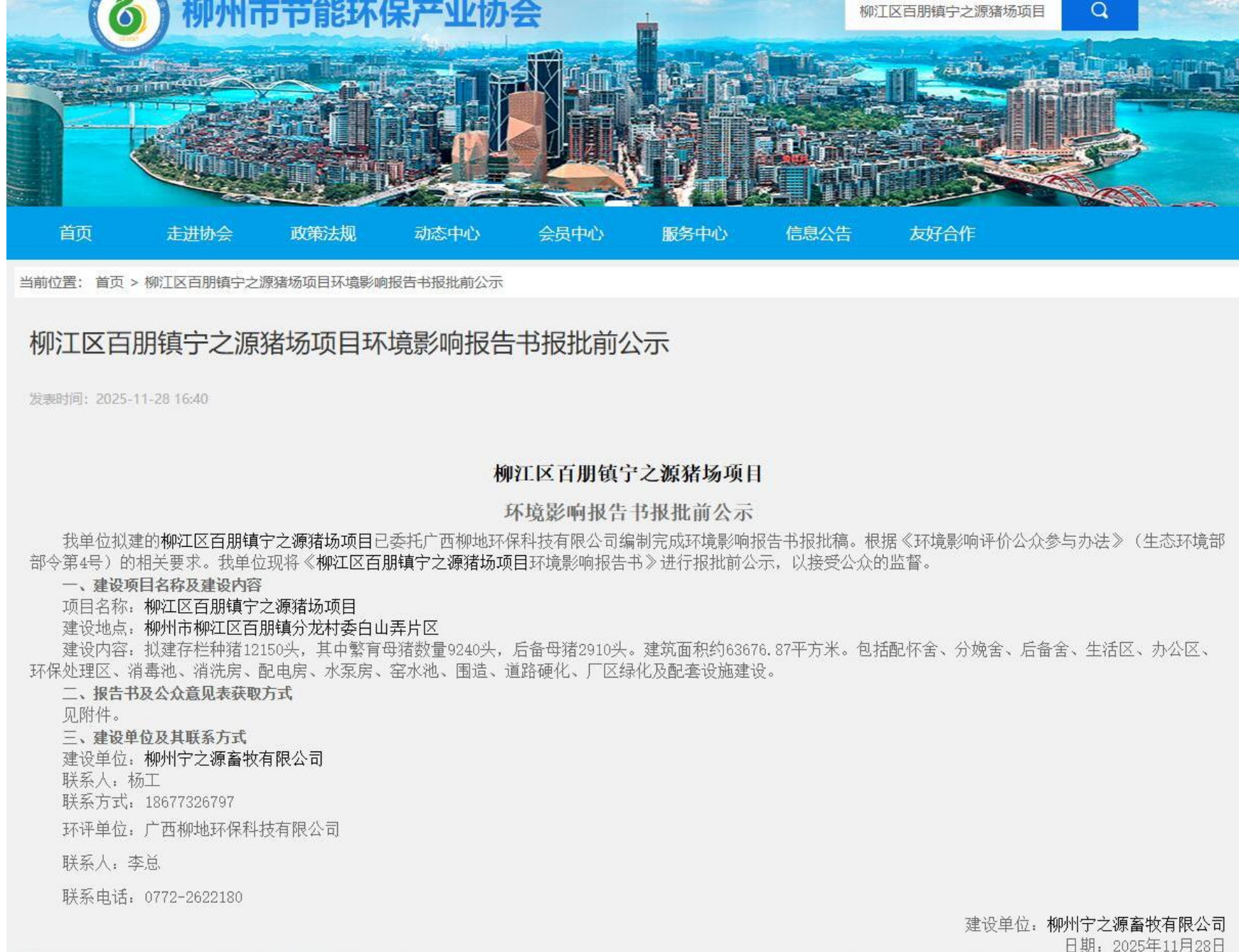
图 7 项目报批前网络公示截图