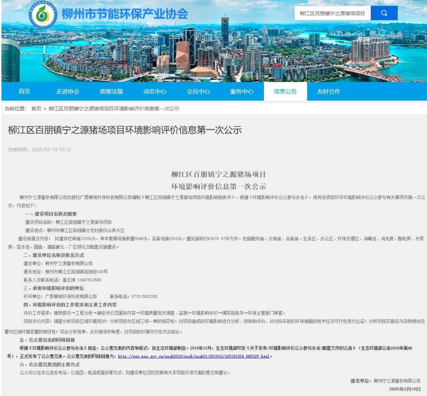
图 1 项目第一次网络公示截图