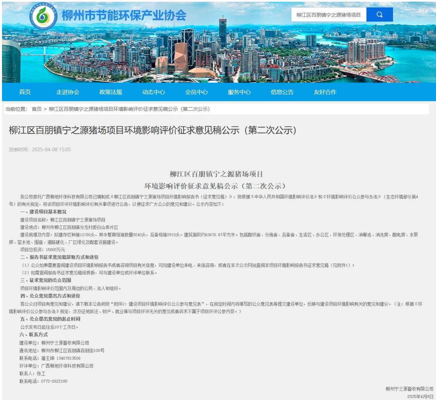
图 2 第二次网络公示截图