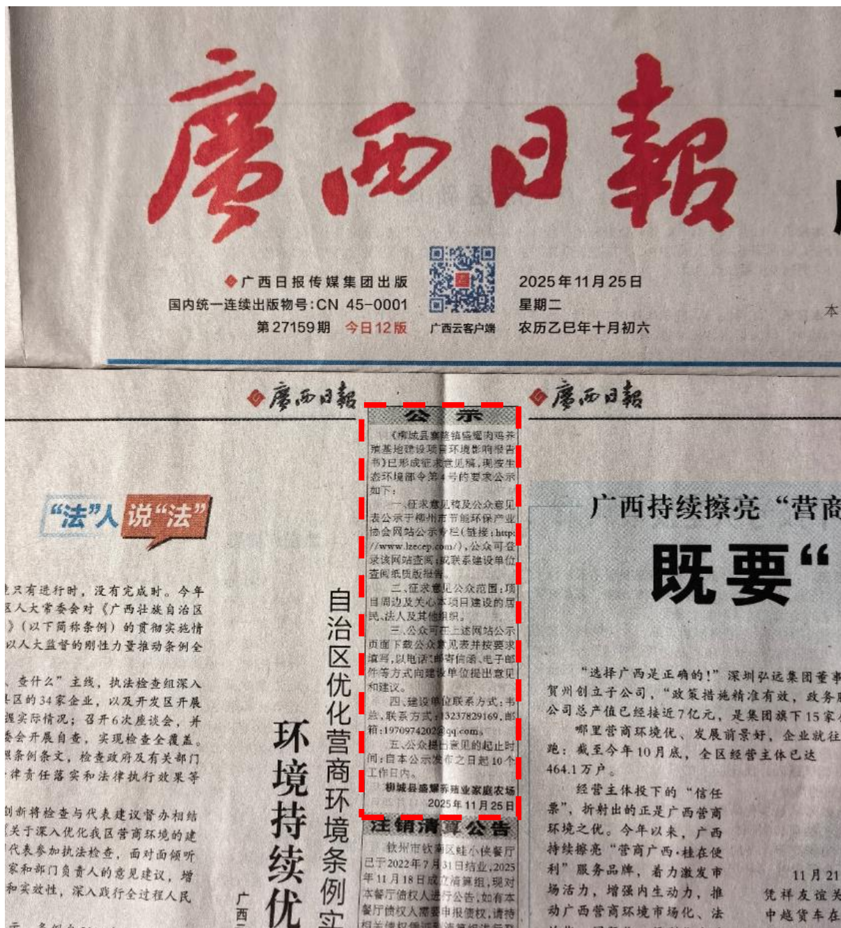
图 3.2-2 第一次《广西日报》刊登信息（虚线框内）

在《广西日报》数字报可查看本项目刊登的征求意见稿公示信息，两次刊登信息链接分别为 https://gxb.gxb.com.cn/?name=gxb&date=2025-11-25&code=013&xuhao=7 和 https://gxb.gxb.com.cn/?name=gxb&date=2025-11-26&code=013&xuhao=6 ，两次公开的报纸见图 3.2-2 和图 3.2-3。