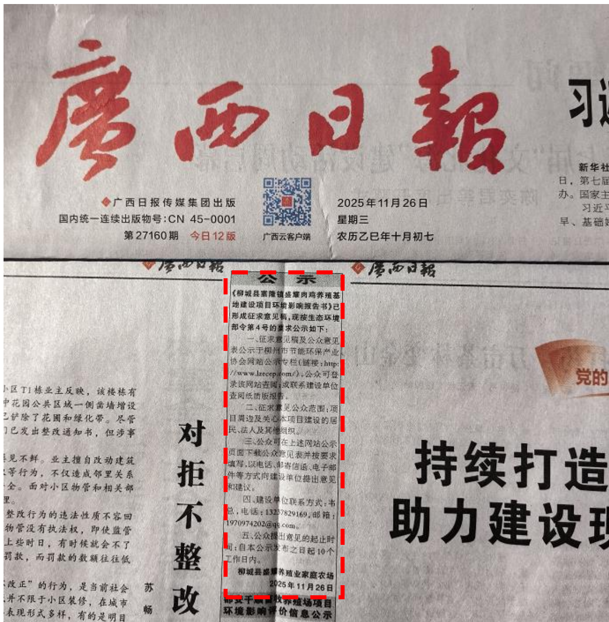
图 3.2-3 第二次《广西日报》刊登信息（虚线框内）