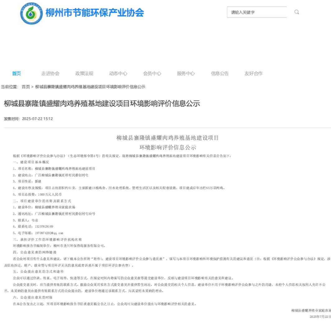
图 2.2-1 首次环境影响评价信息公开网页截图

公示网址为 http://www.lzecep.com/nd.jsp?fromCollId=2&id=349#_np=2_319 ，网页截图见图 3.2-1。