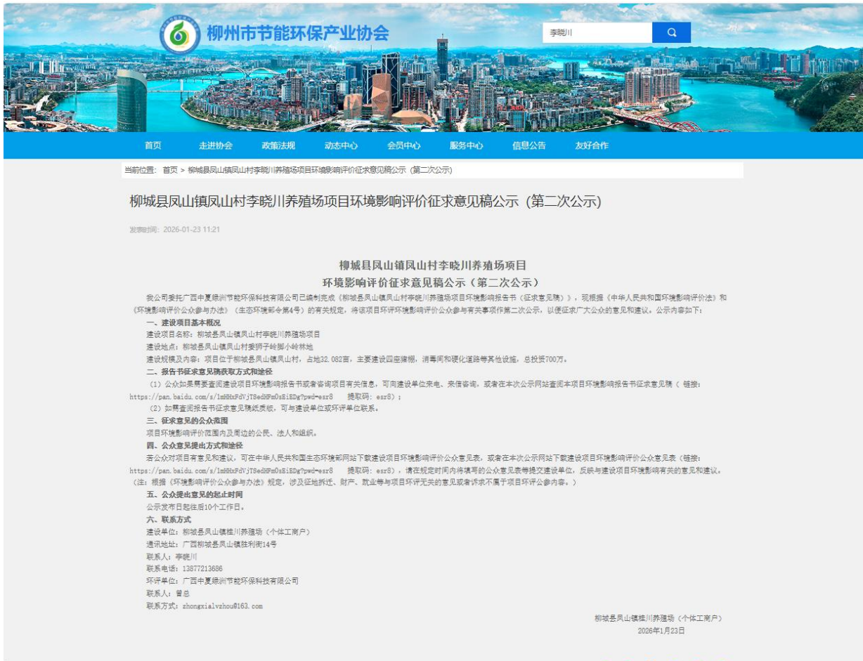
图 2 第二次网络公示截图