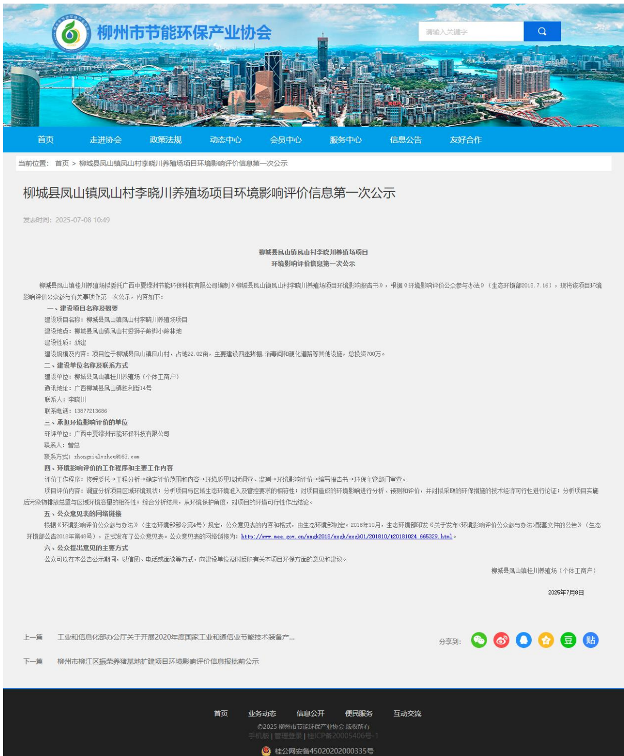
图 1 项目第一次网络公示截图

载体选取符合性分析：建设单位选取柳州市节能环保产业协会网站进行第一次公示，符合《环境影响评价公众参与办法》（生态环境部令第 4 号）相关要求。