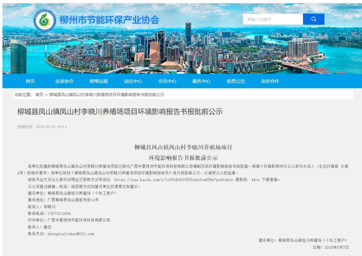
图 5 项目报批前网络公示截图